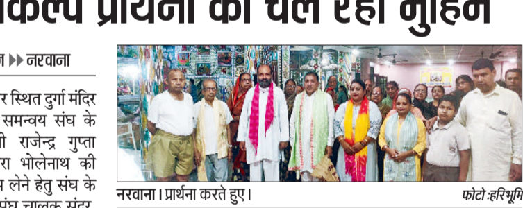
नरवाना। प्रार्थना करते हुए।