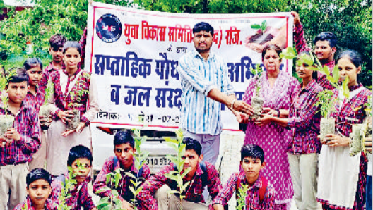
जीद। बच्चों को पौधे वितरित करते समिति सदस्य।