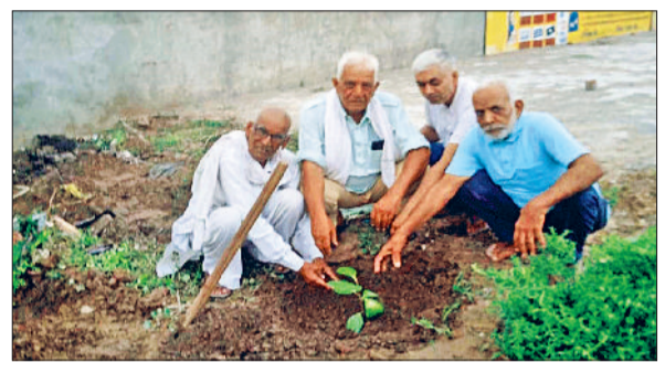
उचना। इमरखा कला में आरोग्य मंदिर में पौधरोपण करत हुए।

जीद। विज्ञान के प्रति विद्यार्थियों में जागरूकता बढ़ाने के उद्देश्य से राज्य शिक्षक अनुसंधान एवं प्रशिक्षण परिषद गुरुग्राम की ओर से खंड और जिला स्तर पर विज्ञान संगोष्ठी का आयोजन किया जाएगा। इसके तहत जुलाई माह के अंत तक खंड स्तर पर प्रतियोगिता आयोजित की जाएगी। सभी खंड शिक्षा अधिकारियों को खंड स्तर पर प्रतियोगिता करने का निर्देश दिया गया है। इसके बाद अगस्त माह की शुरुआत में जिला स्तर पर विज्ञान संगोष्ठी (साइंस सेमिनार) आयोजित की जाएगी। खंड स्तर पर उत्कृष्ट प्रदर्शन वाले विद्यार्थी जिला स्तर की प्रतियोगिता में भाग लेंगे। ये रहेगा श्रेष्ठतम जिला स्तर पर चयनित विद्यार्थी सिविल के प्रथम स्तर में गुरुग्राम में आयोजित राज्य स्तरीय प्रतियोगिता में भाग लेंगे। इसके बाद राष्ट्रीय विज्ञान संगोष्ठी 2025 को बेंगलूर स्थित विश्वेश्वरैया औद्योगिक एवं प्रौद्योगिकी संसद्धान्य में आयोजित की जाएगी। प्रतियोगिता में कक्षा 8वीं से 10वीं तक पढ़ने वाले सरकारी और प्राइवेट स्कूलों के विद्यार्थी भाग ले सकते हैं। सेमिनार शुरू होने से पहले सभी विद्यार्थियों के लिए एक लिखित परीक्षा होगी।