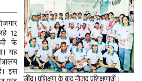
जीद। प्रशिक्षण के बाद मौजूद प्रशिक्षणार्थी।