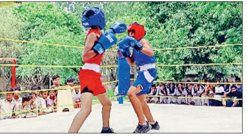
बॉक्सिंग प्रतियोगिता के अंतिम दिन जीत के लिए पसीना बहाते खिलाड़ी।