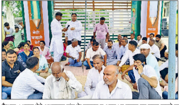
कैथल। धरना देते अध्यापक संघ के सदस्य व अन्य। व स्कूल पर ताला जड़ते एसएमसी सदस्य।

खंड के गांव सेरधा में राजकीय वरिष्ठ माध्यमिक विद्यालय में एक प्राध्यापक के साथ गांव के ही युवकों द्वारा मारपीट करने को लेकर ग्रामीणों ने स्कूल को ताला लगाकर सभी शिक्षक संगठनों के साथ धरने पर बैठे। धरणा स्थल पर अध्यापकों के साथ ग्रामीण व एसएमसी कमेटी के सदस्य भी मौजूद रहे। ग्रामीणों व हरियाणा स्कूल लेक्चर एसोसिएशन के सदस्य अनिश्चित कालीन धरने पर बैठ गए। सरकार व प्रशासन के खिलाफ जमकर नारेबाजी की। इसी बीच प्रशासन की ओर से पुलिस व अन्य