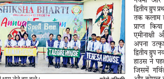
जीद। प्रतियोगिता में भाग लेते हुए बच्चे।

सभी हाउस के बच्चों ने उत्कृष्ट प्रदर्शन किया, जिसकी समस्त स्कूल स्टाफ ने सराहना की हरिभूमि न्यूज >>> नरवाना शिक्षा भारती मॉडल स्कूल में छठी से बारहवीं कक्षा तक के विद्यार्थियों के लिए एक रोमांचक अंतर हाउस अंग्रेजी स्पेलिंग प्रतियोगिता का आयोजन किया गया। इस प्रतियोगिता में स्कूल के चारों हाउस जिसमें रमन स्कूल, कलाम हाउस, टेरेसा हाउस और टैगोर हाउस के छात्रों ने बड़बुदक हिस्सा लिया। बच्चों की इस प्रतियोगिता में अद्भुत