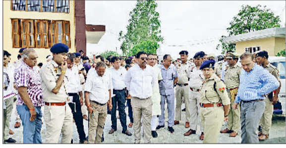
जीद। कार्यक्रम की तैयारियों का जायजा लेते हुए डीसी व एसपी।

वीवीआईपी कार्यक्रम के दौरान ज़ोन, हथियार व वाहनों पर प्रतिबंध डीसी व एसपी ने जुलाना में होने वाले मुख्यमंत्री के कार्यक्रमों