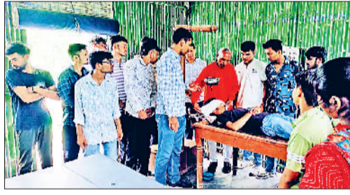
जीद। जानकारी हासिल करते छात्र।