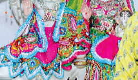
पुंडरी। माता महोल्ला शिव मंदिर में पूजा-अर्चना के दौरान पुजारी।